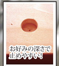
お好みの深さで止めやすい!