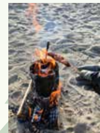
焼き鳥だって焼けます