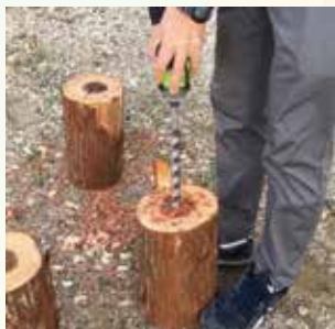
インパクトビットロング 21mm穴あけ中