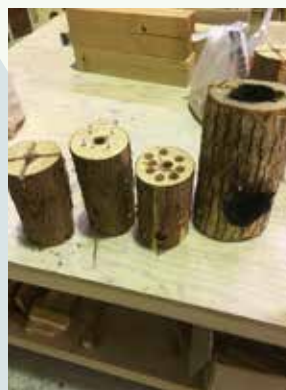
いろんなロケットストーブを 作ってみました