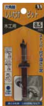
No.41X 六角軸しいたけビット ストッパー付