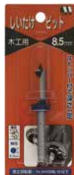
No.41/41B しいたけビット ストッパー付

オガコに米ぬか等の栄養源を加えて固めたものに種菌を接種し、三ヶ月ほど空調設備等を備えた施設内において菌を蔓延させてきのこを発生させる方法です。