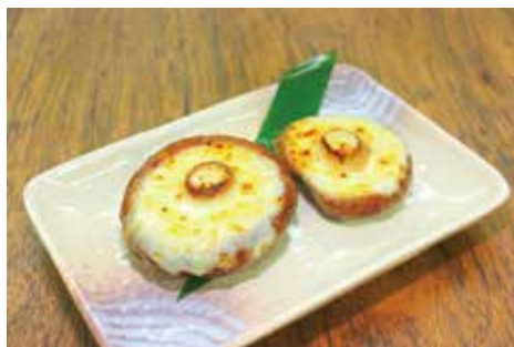
しいたけのチーズ焼き とろけるチーズと相性抜群