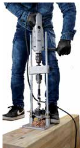
厚みのある材の穴あけ