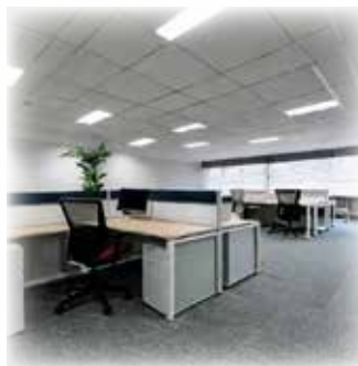
高層ビル等のオフィスのフロア