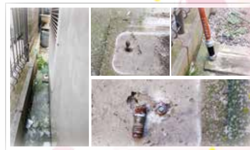
狭い場所での撤去作業