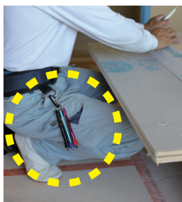
足元安全 しゃがむ作業でも錐先が刺さらず安全