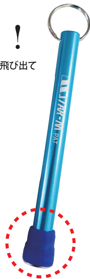
<材質> 本体：アルミ ソケット部： エラストマー （ゴム）