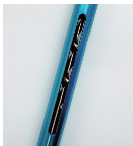
側面スリットあり 中身が確認できる