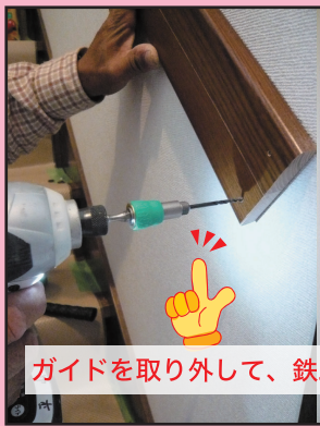
ガイドを取り外して、鉄工ドリルで下穴をあける