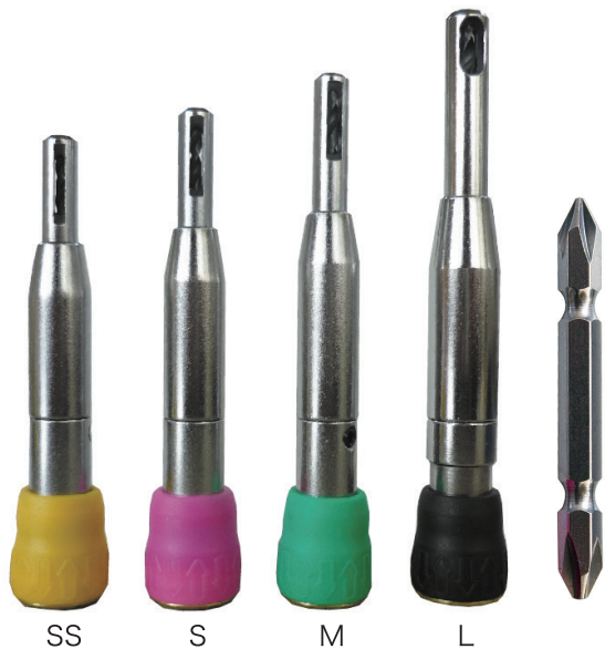
※両頭ビットは各本体に1本セットされています