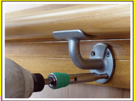
リフォーム階段手摺り施工