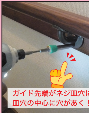
ガイド先端がネジ皿穴にフィット！ 皿穴の中心に穴があく！