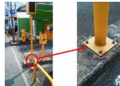
コインパーキング